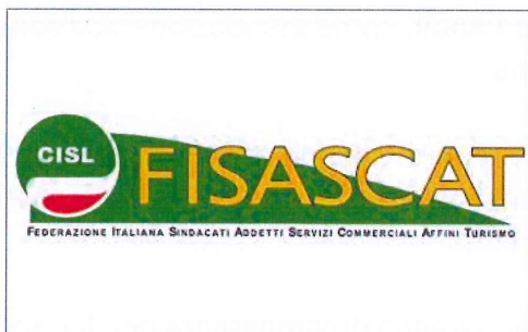
FISASCAT CISL FRIULI VENEZIA GIULIA