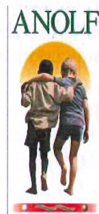
ANOLF REGIONALE FRIULI VENEZIA GIULIA "APS"